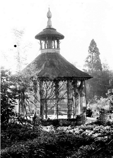
Kiosk in de tuin