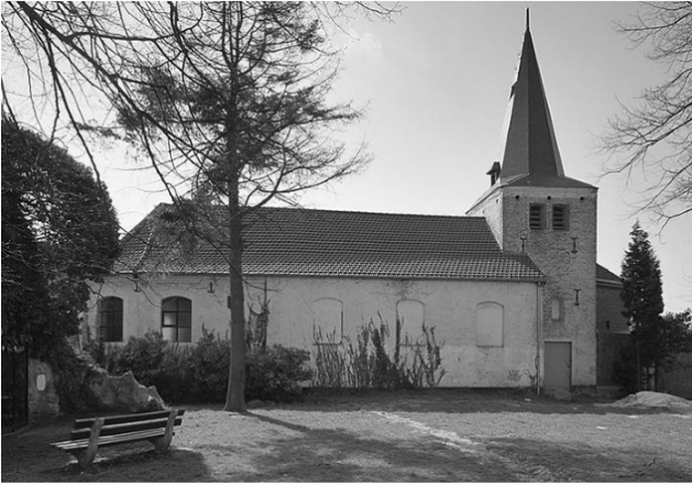
De noordzijde van het Clemenskerkje.

Maar de thuisblijvers hebben wat gemist. Het doel van ons eerste uitstapje was dit voorjaar het Clemensdomein. Gelegen aan de rand van Brunssum, geografisch gezien in Oud-Merkelbeek, ligt hier op de eeuwenoude kruising van twee Romeinse heirwegen, de meest spirituele plek van onze contreien.