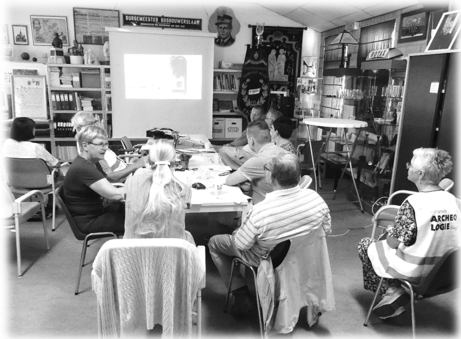
Volop aandacht voor de fotopresentatie

De pauze was in ons verenigingslokaal, waar tussen de koffie en vla de Power Pointpresentatie 'Er was eens' draaide. Ook deze fotoserie van de vele gebouwen en dorpsgezichten die in de loop der jaren verdwenen zijn, werd door Wim aaneen gepraat.