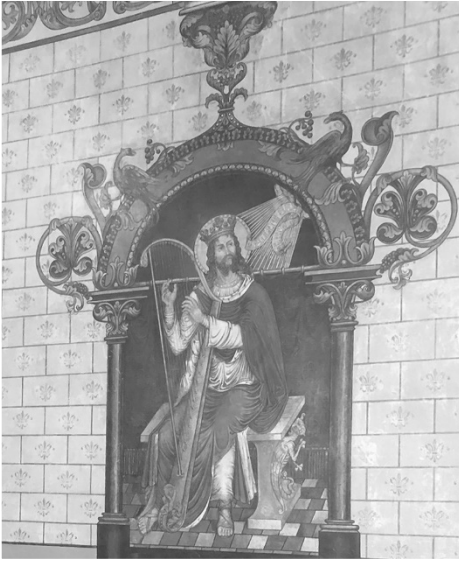
Wandschildering in het kerkje

hier in de elfde eeuw al een kapel stond.