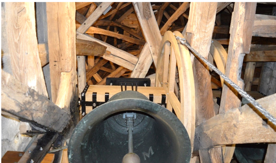
Detail van het vernieuwde drijfwerk

Enige jaren geleden is het eikenhouten drijfwerk in de toren van ons kerkje vernieuwd om weer jaren dienst te doen.